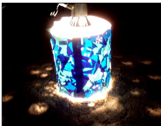
Výsledná práce – hvězdy na noční obloze.