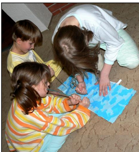
Děrování noční oblohy.