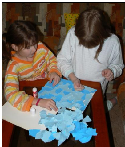
Lepení roztrhaného papíru.