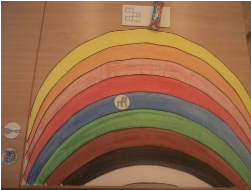
Obrázek č. 2. dítě přenáší bez fyzického vedení, pouze se slovním vedením: „Vezmi modrý obrázek“, „Přenes modrý obrázek“, „Kde je modrá barva duhy?“ Následuje slovní pochvala: „Výborně!“