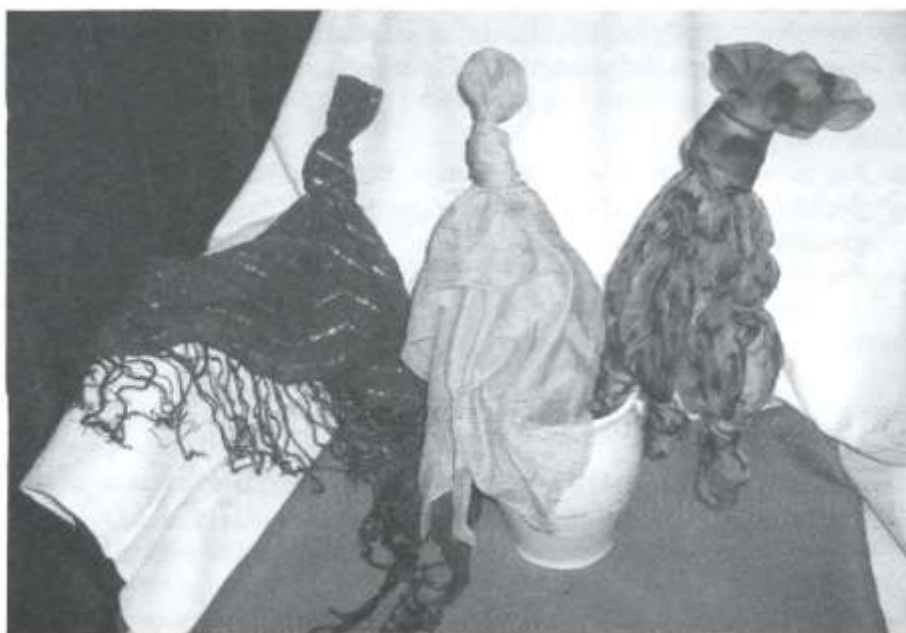
Loutky ze šátků.