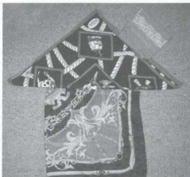
„Kreslení“ se šátkem.